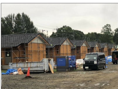
▲完成が近づく仮設住宅

2020年7月に熊本県で発生した集中豪雨による被害を受けて、熊本県では応急仮設木造住宅を建設しています。8月下旬に関東地域(東京除外)の県連組合にも急遽要請があり、千葉土建からは、10人の仲間が現地でする奮闘し、組合の力を存分に発揮しています。